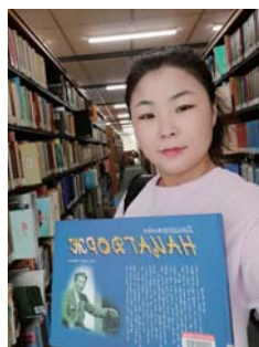
東京外国語大学 大学院