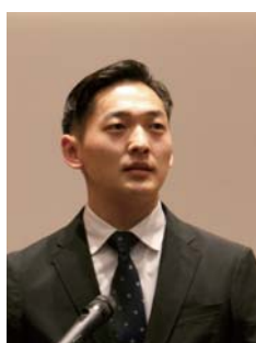
東京国際大学 大学院