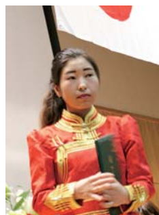
東京外国語大学 大学院