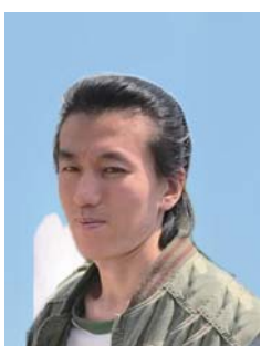
千葉大学大学院 美術専攻