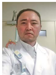
東海大学大学院 医学研究科博士