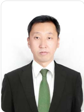
升学指导担当（博士）