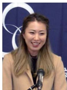
ファッションデザイナー