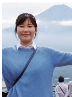
東京外国語大学 大学院